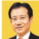
前 文部科学副大臣 鈴木 寛 氏